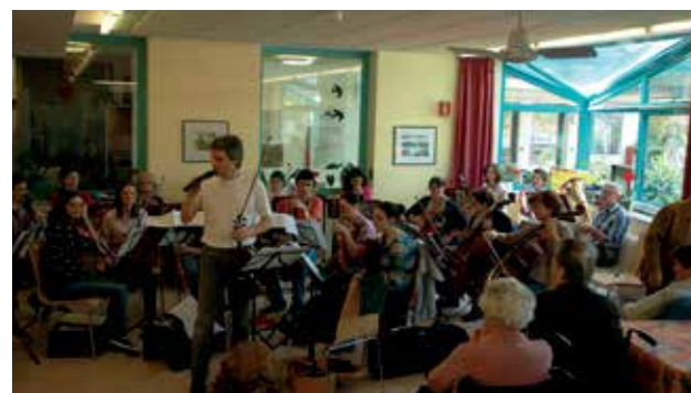
Einen Ohrenschaus besonderer Art bot der Orchesterverein „Streichholz und Fiedl“ in unserem Haus.