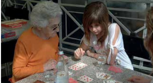
Hmmm- wohin könnte diese Karte passen? Beim Rommè - Spielen auf der Sonnenterrasse genießen wir den Frühling.