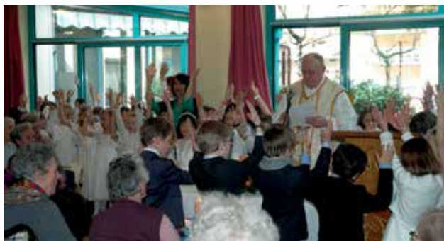
Gemeinsam mit den Erstkommunikanten feierten wir dieses bedeutsame Fest. Mit Texten und Liedern gestalteten die Kinder die Heilige Messe im Altenheim bunt und lebendig.