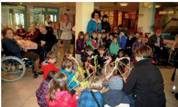
Hallo Frühling! Die Kindergartenkinder leisten uns bei der Singstunde Gesellschaft und begrüßen mit Liedern und bunten Fähnchen den Frühling.