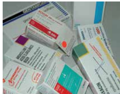
Das Angebot an Antibiotikas ist sehr vielfältig.