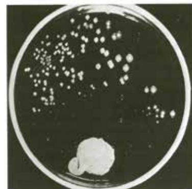
Das ist die Originalaufnahme der Staphylokokkenkultur, die Dr. Fleming auf die Idee brachte, Bakterien mit anderen Mikroorganismen zu bekämpfen.

Natürlich hat auch dieses Medikament seine Nebenwirkungen, wie Übelkeit und Durchfall, manchmal Allergien, Hautpilze (rötliche, juckende Flecken). Das größte Risiko aber ist, dass sich die Krankheitserreger auf Dauer an die Antibiotika gewöhnen („Resistenz“), sie damit unwirksam machen.