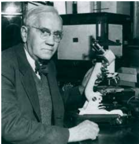
Dr. Alexander Flemming, der Entdecker des Penicillins

Wir befinden uns wieder mitten drin - in der Infektsaison. Bei diesem nasskalten Wetter hat man sich schnell Husten, Schnupfen, Fieber, kurz, einen grippalen Infekt, eingefangen. Die Erwartung vieler Menschen, wenn sie mit diesen Beschwerden zum Arzt gehen: Er verschreibt ihnen etwas, was die Symptome lindert. Am besten natürlich ein Antibiotikum. Allein der Begriff scheint schon dafür zu stehen, dass Krankheitssymptome schnell und erfolgreich verschwinden.