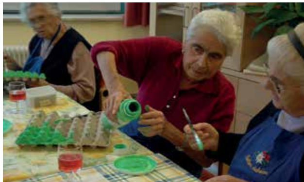
Mit dem Bemalen der Dekoration wächst auch die Vorfreude auf den Frühling. Und alle helfen mit, denn viele Hände machen der Arbeit ein rasches Ende.