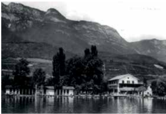
Der Badebetrieb „Gretl am See“ vor seinem Umbau