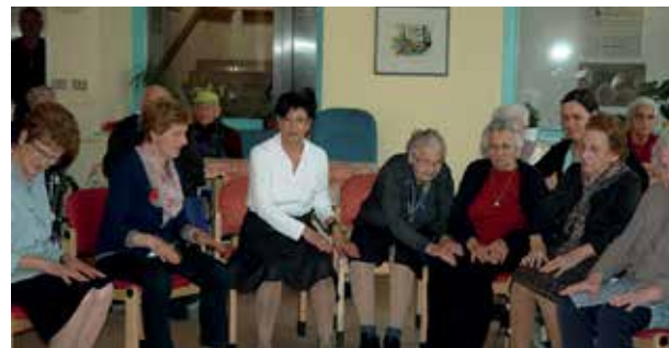
Rechter Nachbar, linker Nachbar – da ist Konzentration gefragt! Viel Spaß hatten wir bei den Sitztänzen gemeinsam mit der „Frauentanzgruppe Kaltern“.