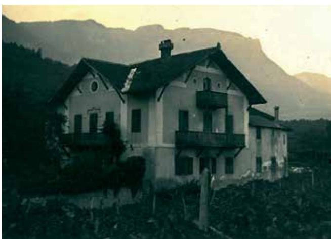
Der Barleiterhof hat sein ursprüngliches Aussehen immer beibehalten