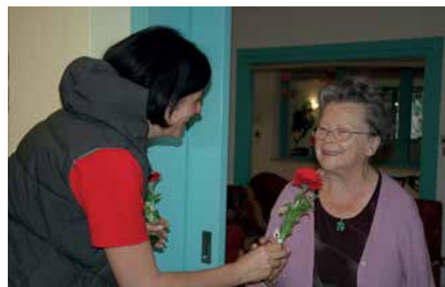
Mit einem Blumengruß und köstlichen Torten gratulierten die Kalterer Bäuerinnen unseren Heimbewohnerinnen zum Muttertag.